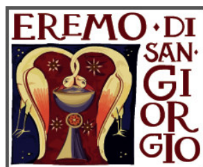
Azienda Agricola Monte San Giorgio